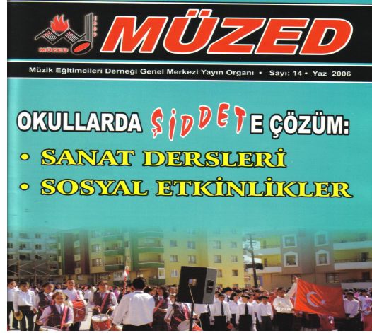
MÜZED Dergisi ( Yaz 2006 )

SANATLAR”ın, şiddeti, “oluşmadan” önleme potansiyeli konusunu vurgulayabilmek açısından kısaca yer vermekte yarar bulunmaktadır: