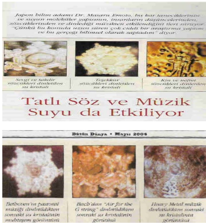
Resim 6 ve Resim 7

Yapılan deneyler; su kristallerinin dinletilen müzik türüne bağlı olarak seslerden nasıl etkilendiğini ortaya koymuştur (Ergöz, 2004):