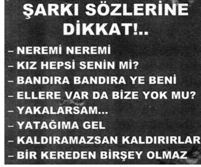
Resim 1 – GARAM Araştırmasında Belirtilen Şarkı Sözleri

Konuyla ilgili bir internet haberine de, bildiri kapsamında yer verilebilir ( www.mynet.com ):