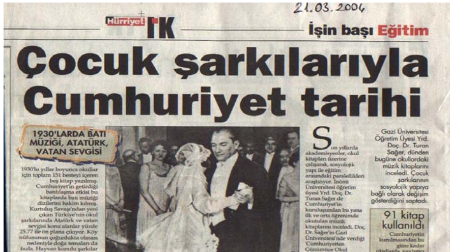
Resim 4 – Çocuk Şarkılarını inceleyen doktora tezinin yer aldığı gazete haberi